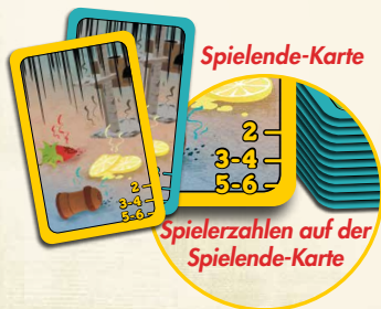
Spielende-Karte Spielerzahlen auf der Spielende-Karte